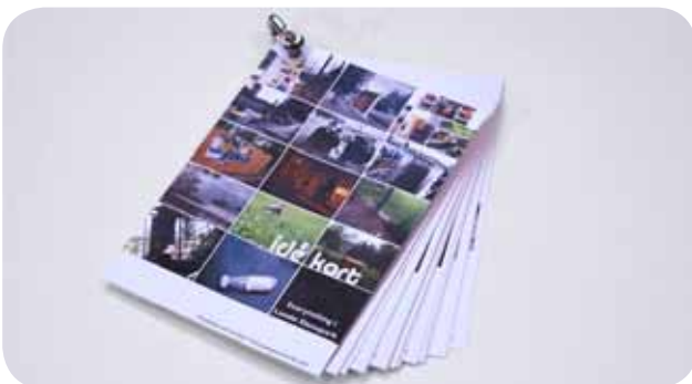
Lunde Slusepark Drift AS Historiefortelling og stedsutvikling