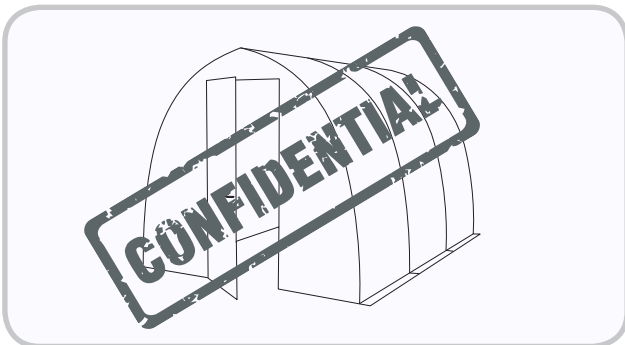
UNI-Hall Fleksibel flerbrukshall