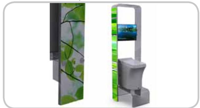
Ecotech AS Butikkstand