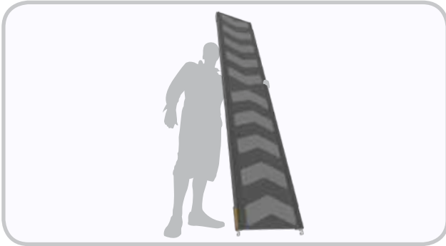
Arctic Plast AS Glassfiberarmert stilasplank