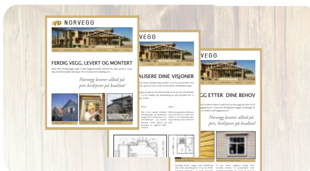
Norvegg AS Nettløsning