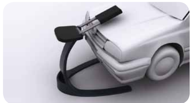
Kleiva Bilverksted Avlastningsutstyr for bilmekanikere