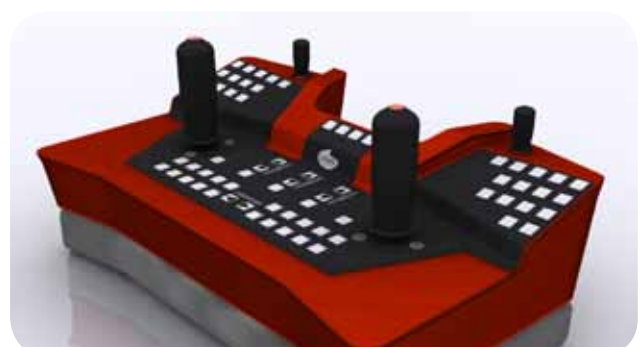
Sperre AS Fjernkontroll til ROV