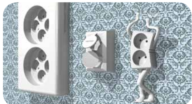
Norner Innovation AS Plastlæring på en fornøylig måte