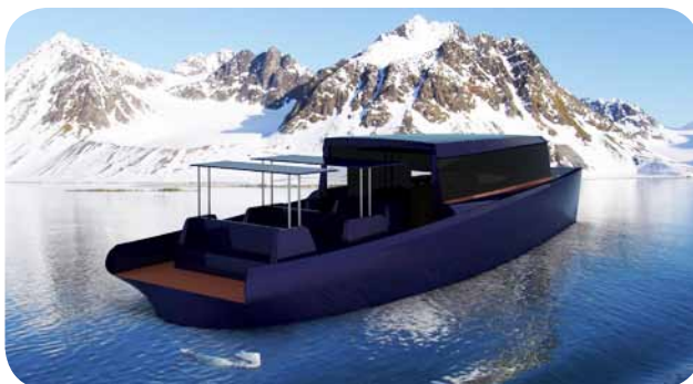
Tøllefsen Båt Turistbåt for arktiske strøk