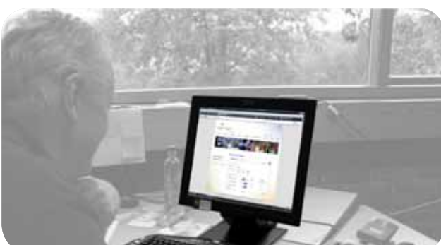
Norner Innovation AS Plastdatabasen