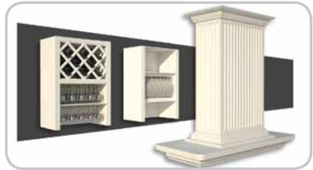
Herregård AS Interiørprodukter til kjøkken