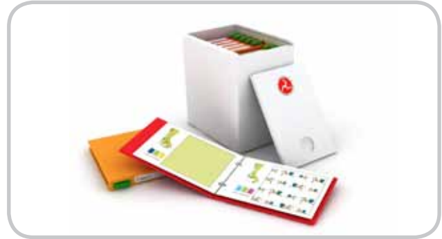
Nord-Norges Ortopediske Verksted AS Kolleksjon for barneortoser